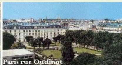
Paris rue Oudinot