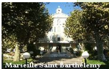
Marseille Saint Barthélemy

« Dans l'Eglise et dans le monde au service de l'Hospitalité. Priorités de l'Ordre dans l'Europe d'aujourd'hui. »