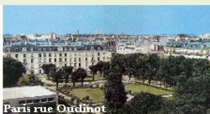
Paris rue Oudinot