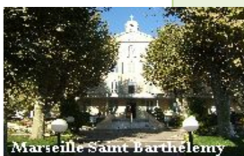
Marseille Saint Barthélemy

« Dans l'Eglise et dans le monde au service de l'Hospitalité. Priorités de l'Ordre dans l'Europe d'aujourd'hui. »