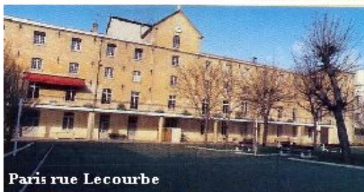
Paris rue Lecourbe