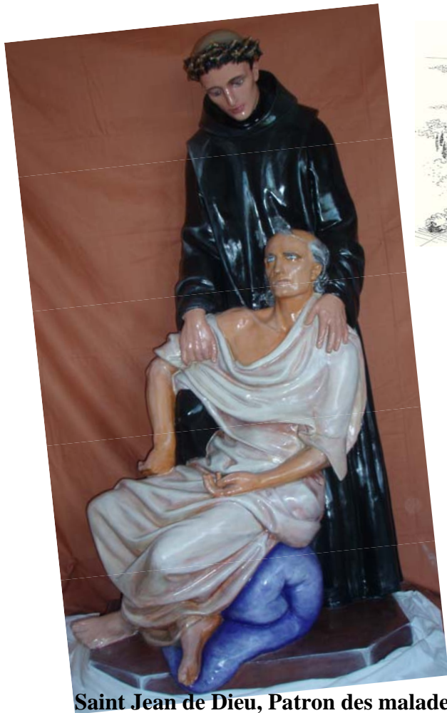
Saint Jean de Dieu, Patron des malades et du personnel hospitalier