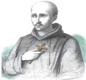
Saint Jean de Dieu (1495—14550)